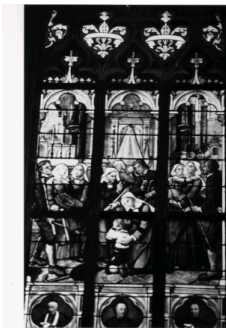
vitrail de la basilique représentant le miracle où trois enfants de Camors furent miraculeusement guéris le 25 mai 1728